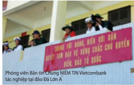
Phóng viên Bản tin Chung NIỀM TIN Vietcombank tác nghiệp tại đảo Đá Lớn A

Đoàn công tác đã tổ chức nhiều hoạt động, với tinh thần trách nhiệm cao nhất; gần gũi, tiếp xúc, thăm hỏi, động viên và tặng quà cho quân và dân trên quần đảo Trường Sa, Nhà giàn DK1, với tổng số 538 thùng quà (trong đó có 122 thùng của Vietcombank); 1.000 cây phi lao; 300 cây dừa; 400 cây hoa giấy; 200 cây ổi; 400 bao đất cùng một số vật dụng khác phục vụ nhu cầu sinh hoạt, học tập, công tác của bộ đội và nhân dân trên các đảo, điểm đảo và Nhà giàn DK1. Đặc biệt, nhân dịp này, Vietcombank đã trao tặng 03 xuồng CQ trị giá 10 tỷ 500 triệu cho cán bộ, chiến sỹ hải quân tại Lễ tiếp nhận được tổ chức tại thị trấn Trường Sa trên đảo Trường Sa. Ngoài ra, Bảo hiểm xã hội Việt Nam cũng trao tặng 01 tỷ đồng cho Quân chủng Hải quân; Bệnh viện Quân y 175 đã tổ chức tư vấn và cung cấp đường dây nóng sẵn sàng tiếp nhận cán bộ, chiến sĩ và người thân đến khám, điều trị với mức ưu đãi cao nhất, tiến hành thăm các cơ sở quân y trên các đảo, nhà giàn; động viên và trao đổi kinh nghiệm với các thầy thuốc đang trực tiếp công tác tại đảo và nhà giàn. Thông qua đó đã kịp thời động viên quân, dân và cán bộ, chiến sỹ trên các đảo, nhà giàn yên tâm, phấn khởi trụ vững nơi đầu sóng ngọn gió, bảo vệ vững chắc chủ quyền biển, đảo thiêng liêng của Tổ quốc.