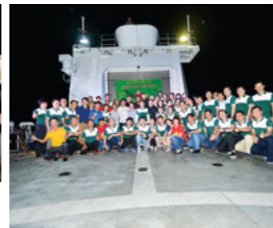
Bản sắc và sự nhiệt tình của các thành viên Vietcombank luôn mang đến sự gắn kết cho các thành viên của Đoàn công tác số 13 trên tàu KN-290