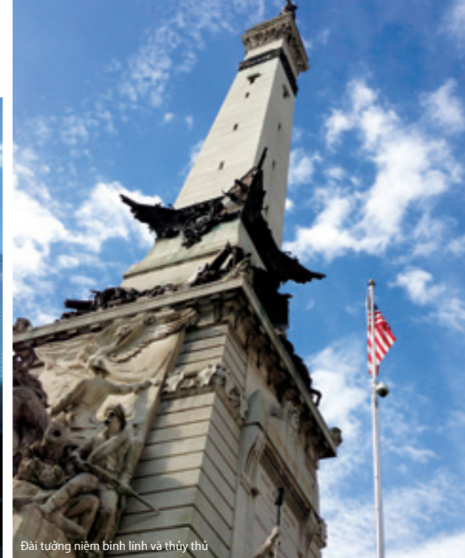
Đài tưởng niệm binh lính và thủy thủ

Lò dò đưa thân người ra ngoài ban công được bao bọc bằng những tấm kính dày, tôi cảm giác mình như được làm một con Kingkong khổng lồ khi những ngôi nhà cao vợi vợi của Chicago đều được nằm dưới đôi chân của mình.