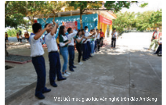
Một tiết mục giao lưu văn nghệ trên đảo An Bang

Đến thăm các đảo, nhà giàn, các hạt nhân văn nghệ của Vietcombank và Đoàn nghệ thuật múa rối Hải Phòng đã phối hợp chặt chẽ với đội ngũ cán bộ là hạt nhân văn hóa văn nghệ của các Đoàn đại biểu: Viện Quân y 175/BQP, Trung ương Hội nạn nhân chất độc da cam/Đioxin Việt Nam; cán bộ, chiến sỹ trên các đảo, nhà giàn, Tàu KN - 290/Vùng 2... tổ chức nhiều chương trình biểu diễn với nhiều tiết mục gần gũi, ca ngợi về biển, đảo, về quê hương, đất nước, về người chiến sỹ Hải quân nơi đảo xa, phục vụ tận tình để động viên kịp thời cán bộ, chiến sỹ các lực lượng và nhân dân trên các đảo, nhà giàn.