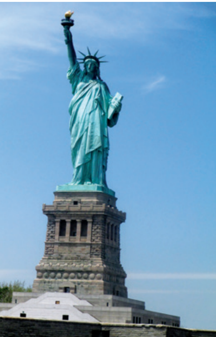
Tượng Nữ thần tự do