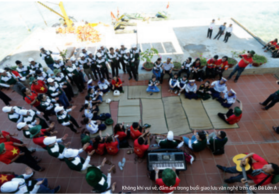
Không khí vui vẻ, đầm ấm trong buổi giao lưu văn nghệ trên đảo Đá Lớn A