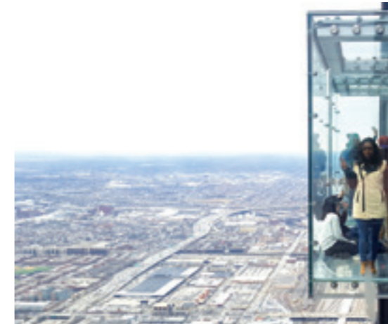
Nhìn từ toà tháp The Sears

Tiếp cuộc hành trình, tôi bắt taxi đến với khu vực số 0 (Zero Zone) để thăm đài tưởng niệm vụ khủng bố rúng động thế giới ngày 11/9 mới được cất băng khánh thành không lâu trước đó. Chạm tay vào thành đá mát lạnh khắc tên của những người đã mất, tôi nhìn lên một tòa nhà cao vút đang còn xây dựng dang dở. Sau này tìm hiểu thêm mới biết đó là One World Trade Center (Trung tâm Thương mại Một Thế - 1 WTC) và có tên gọi khác Freedom Tower (Tháp Tự do). Đây là tòa tháp cao 546,2m, được xây trên nền của tòa tháp đôi WTC bị đánh sập hồi 11/9/2001. Công trình khởi công ngày 27/4/2006 và khánh thành ngày 3/11/2014 với chi phí ước tính 3,9 tỉ USD, gồm 104 tầng chính, 5 tầng hầm, đài quan sát, tháp anten... Được mở cửa cho khách tham quan vào ngày 29/05/2015, đây là tòa nhà cao nhất nước Mỹ và là một trong số các tòa nhà cao nhất thế giới. Cũng chỉ mất có... 47 giây để đi thang máy lên phòng quan sát, One World Trade Center đạt một tiêu chuẩn mới về thiết kế và tính bền vững nên được coi là một trong những tòa nhà văn phòng an toàn nhất ở Mỹ, điều mà thị trường