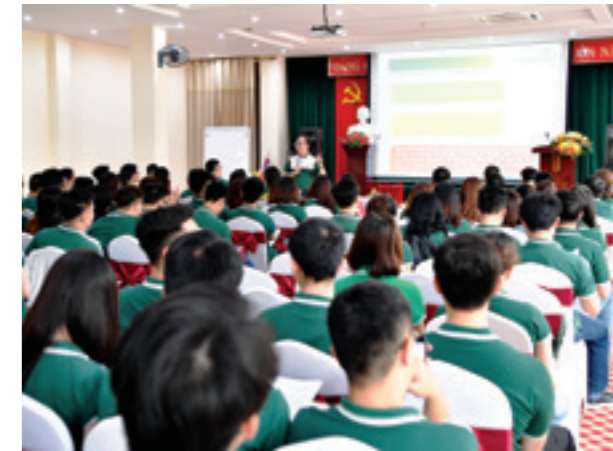
Các đoàn viên tập trung nghe báo cáo viên chia sẻ những kiến thức công tác Đoàn trong Hội nghị tập huấn

T rong chương trình tập huấn, các cán bộ Đoàn Vietcombank đã được hướng dẫn các kiến thức và kỹ năng nghiệp vụ công tác Đoàn như: công tác tuyên truyền giáo dục, công tác quản lý và phát triển đoàn viên, công tác tổ chức, công tác triển khai các hoạt động phong trào... đồng thời được giải đáp những vướng mắc, khó khăn trong quá trình hoạt động đoàn tại cơ sở. Bên cạnh đó, báo cáo viên cũng đã quán triệt những nội dung quan trọng trong Nghị quyết Đại hội đoàn các cấp, những thông tin về thành tựu của Vietcombank trong 55 năm qua, định hướng phát triển và quan điểm chỉ đạo điều hành của Ban Lãnh đạo Vietcombank.