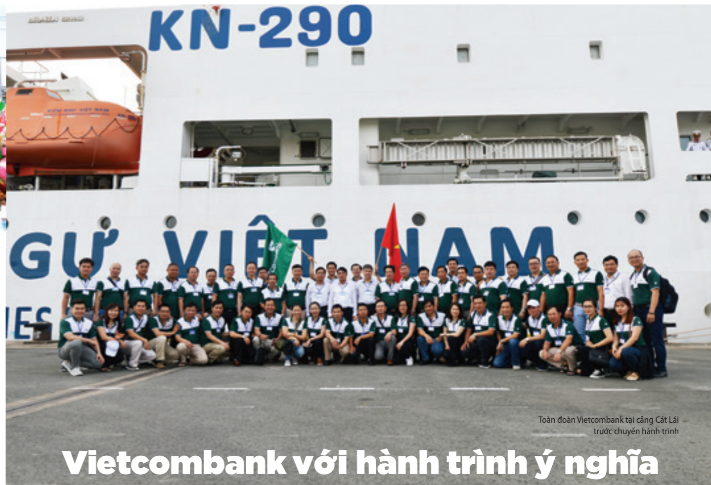
Toàn đoàn Vietcombank tại cảng Cát Lái trước chuyến hành trình