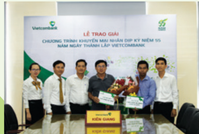
Cán bộ và nhân viên Vietcombank Kiên Giang chụp ảnh lưu niệm cùng khách hàng trúng giải

Chiều ngày 11/5/2018, trong không khí ấm áp và trang trọng, tại trụ sở Chi nhánh, Vietcombank Kiên Giang đã tổ chức lễ trao thưởng CTKM “55 năm đồng hành - Ngàn quà tặng gắn kết” đến các khách hàng đã may mắn trúng giải của tuần 2.