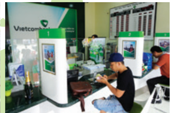
Những khách hàng đầu tiên giao dịch tại PGD Phú Vang