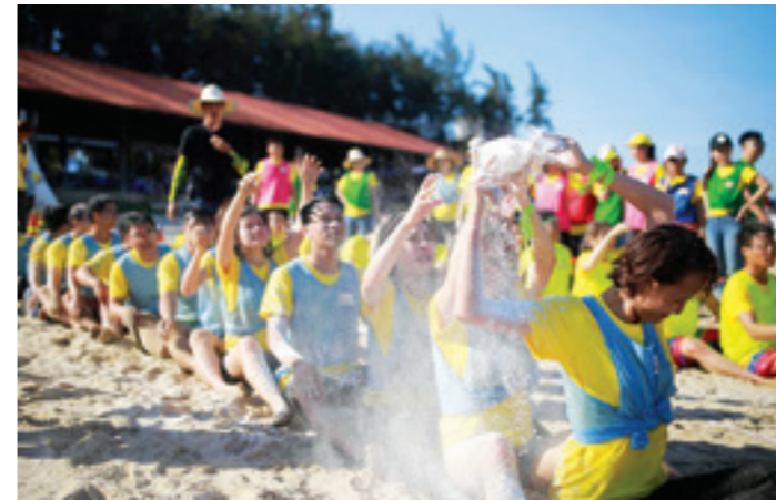
Tham gia các hoạt động teambuilding để gắn kết các thành viên trong chương trình tập huấn