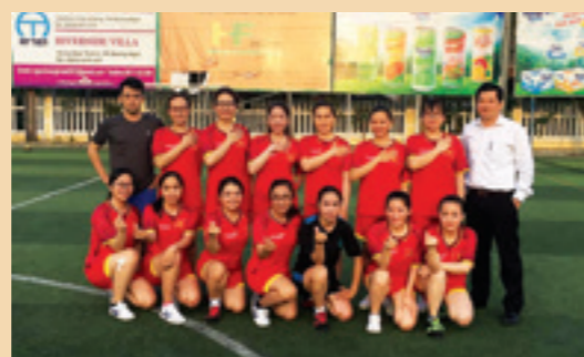
Đội bóng đá nữ Vietcombank Dung Quất