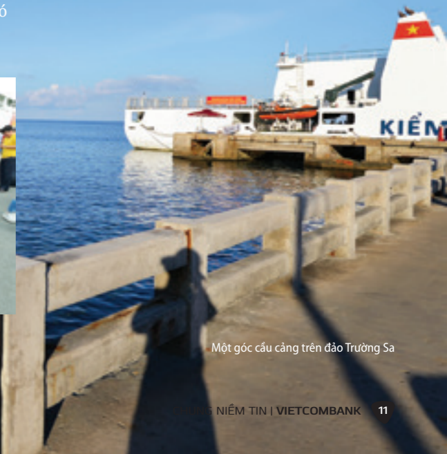
Một góc cầu cảng trên đảo Trường Sa