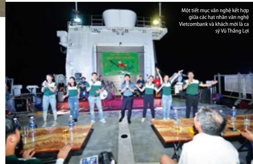
Một tiết mục văn nghệ kết hợp giữa các hạt nhân văn nghệ Vietcombank và khách mời là ca sỹ Vũ Thăng Lợi