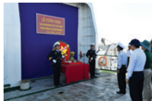
Lễ tưởng niệm các Anh hùng Liệt sỹ hy sinh trên thềm lục địa phía Nam