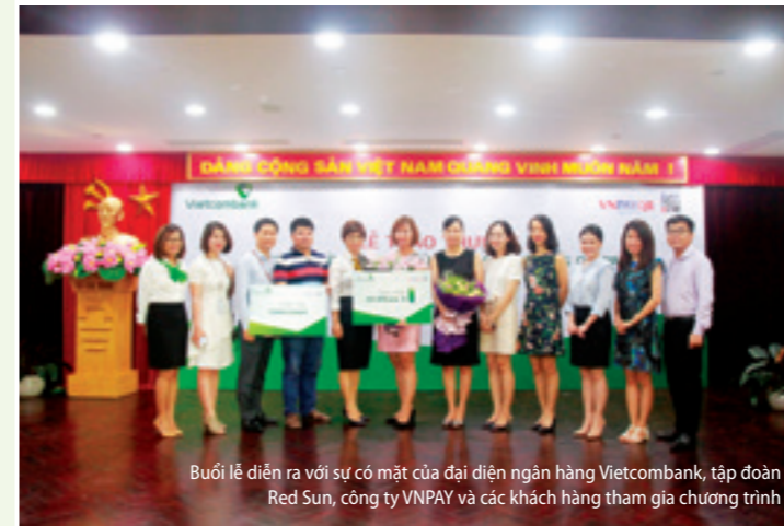
Buổi lễ diễn ra với sự có mặt của đại diện ngân hàng Vietcombank, tập đoàn Red Sun, công ty VNPAY và các khách hàng tham gia chương trình