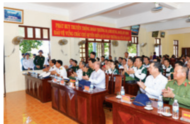
Quang cảnh buổi gặp mặt và tặng quà quân và dân trên đảo Trường Sa và Lễ tiếp nhận 03 xuồng CQ trị giá 10,5 tỷ đồng do Vietcombank tặng Quân chủng Hải quân

Chuyến thăm cán bộ, chiến sỹ, các lực lượng và nhân dân trên quần đảo Trường Sa, Nhà giàn DK1 năm 2018 của Đoàn công tác số 13 đã thành công tốt đẹp, bảo đảm an toàn tuyệt đối về mọi mặt. Thông qua chuyến đi, các thành viên trong đoàn công tác đều cảm nhận sâu sắc, tận mắt chứng kiến cuộc sống sinh hoạt, học tập, công tác của cán bộ, chiến sỹ và nhân dân trên các đảo, nhà giàn; khâm phục, tự hào, tin tưởng vào ý chí và sự quyết tâm vượt qua mọi khó khăn gian khổ của cán bộ, chiến sỹ và nhân dân trên quần đảo Trường Sa và Nhà giàn DK1. Qua chuyến đi, mỗi thành viên trong đoàn công tác hiểu thêm về cuộc sống khó khăn gian khổ, vất vả của quân và dân trên các đảo, nhà