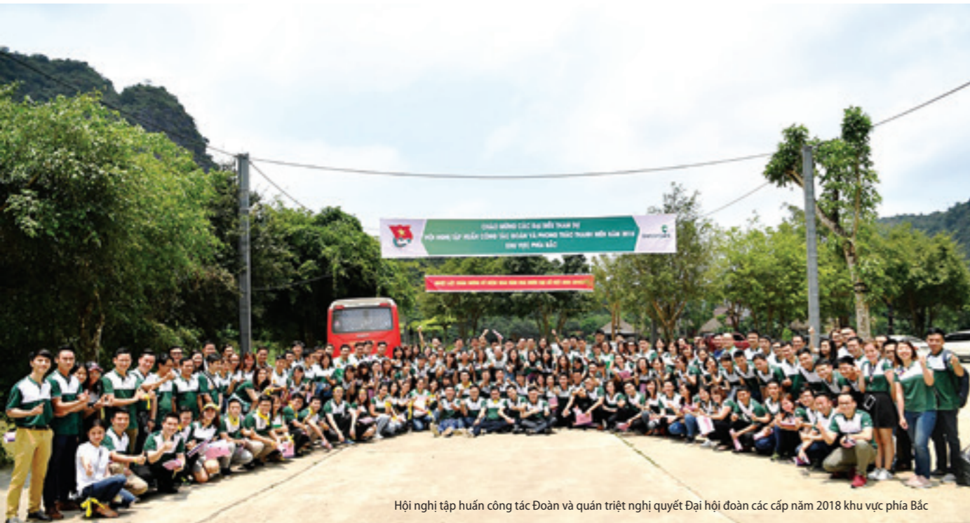
Hội nghị tập huấn công tác Đoàn và quán triệt nghị quyết Đại hội đoàn các cấp năm 2018 khu vực phía Bắc