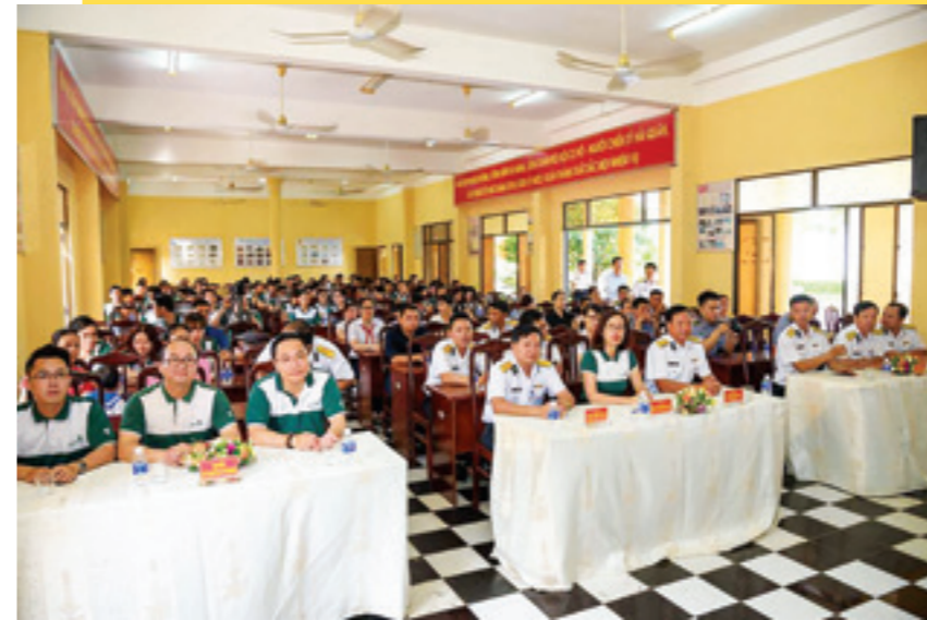
Chương trình ASXH được diễn ra tại Hải đoàn 129

Hành trình về nguồn là chuyến đi vô cùng ý nghĩa, giúp mỗi đảng viên nhận thức sâu sắc hơn về công lao của Bác Hồ đối với sự nghiệp cách mạng của dân tộc, khơi dậy tinh thần yêu nước, phấn đấu rèn luyện và học tập theo tấm gương đạo đức Hồ Chí Minh.