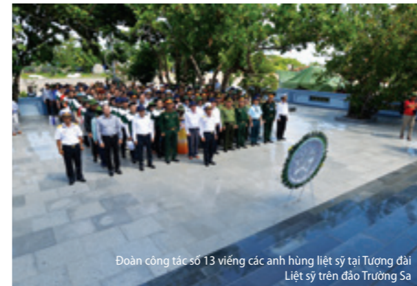
Đoàn công tác số 13 viếng các anh hùng liệt sỹ tại Tượng đài Liệt sỹ trên đảo Trường Sa