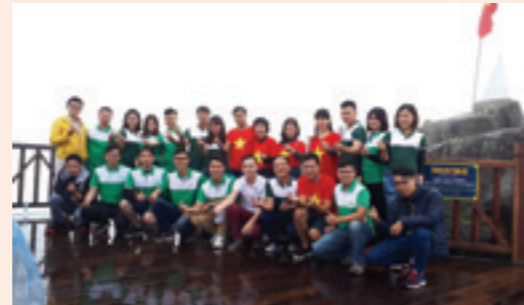
Tổng kết quý III/2017, Sapa

Vietcombank trong tôi, là một ngày đầu tháng 8, khi bầu trời vẫn còn vương lại những vạt nắng vàng sôi nổi của mùa Hè, ngày đầu tiên tôi tiếp nhận công việc, được phân công vào phòng Khách hàng thể nhân theo sự chỉ