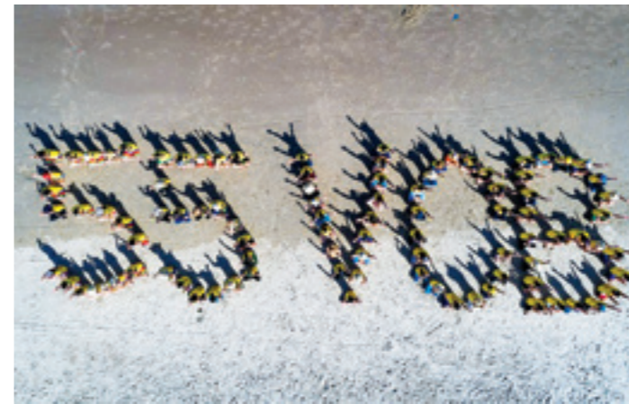
Vietcombank luôn trong trái tim CBNV khu vực phía Nam

THỰC HIỆN CHƯƠNG TRÌNH CÔNG TÁC ĐOÀN VÀ PHONG TRÀO THANH NIÊN NĂM 2018, BAN THƯỜNG VỤ ĐOÀN THANH NIÊN VIETCOMBANK ĐÃ TỔ CHỨC THÀNH CÔNG HỘI NGHỊ TẬP HUẤN CÔNG TÁC ĐOÀN VÀ QUÁN TRIỆT NGHỊ QUYẾT ĐẠI HỘI ĐOÀN CÁC CẤP NĂM 2018 TẠI HAI KHU VỰC: KHU VỰC PHÍA NAM (14 - 15/4/2018) VÀ KHU VỰC PHÍA BẮC (21 - 22/4/2018).