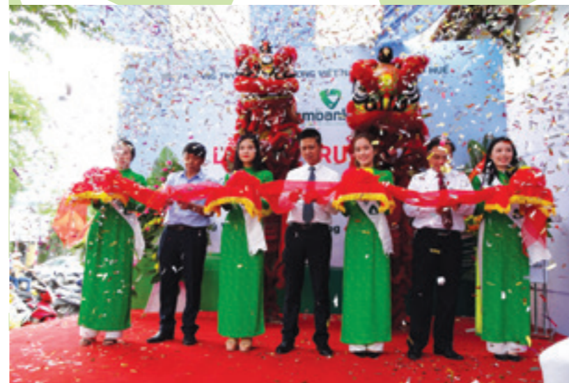
Lãnh đạo huyện Phú Vang, Lãnh đạo Ngân hàng Nhà nước Việt Nam – Chi nhánh tỉnh Thừa Thiên Huế và lãnh đạo Vietcombank Huế thực hiện nghi lễ cắt băng khai trương PGD Phú Vang