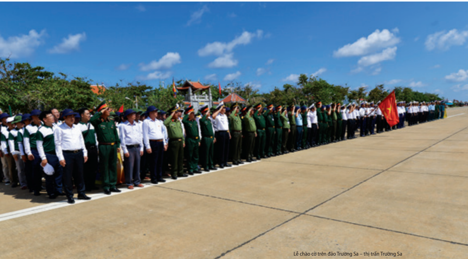
Lễ chào cờ trên đảo Trường Sa – thị trấn Trường Sa