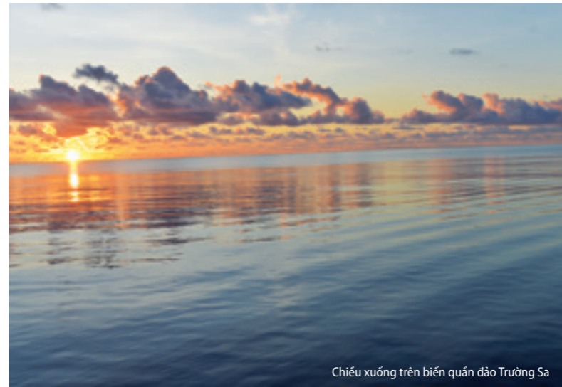
Chiều xuống trên biển quần đảo Trường Sa

Đoàn công tác cũng đã tổ chức đến thăm viếng và dâng hương tại Nhà tưởng niệm Chủ tịch Hồ Chí Minh; Đài tưởng niệm các liệt sỹ trên thị trấn Trường Sa; thăm các công trình nhà văn hóa, nhà khách, nơi ăn, ở, sinh hoạt học tập, công tác của cán bộ, chiến sỹ; thăm các hộ dân tại thị trấn Trường Sa. Đoàn cũng đã tổ chức Lễ tưởng niệm các anh hùng liệt sỹ đã hy sinh tại vùng biển Gạc Ma, Cô Lin, Len Đao và thềm lục địa phía Nam của Tổ quốc với nghi lễ nghiêm túc, trang trọng, xúc động, mang ý nghĩa tâm linh sâu sắc để tưởng nhớ những cán bộ, chiến sỹ HQNDVN đã anh dũng hy sinh vì sự nghiệp bảo vệ chủ quyền biển, đảo thiêng liêng của Tổ quốc.