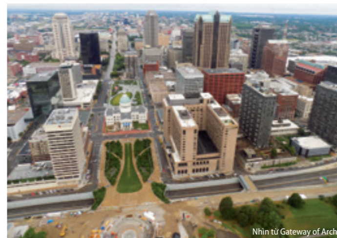
Nhìn từ Gateway of Arch