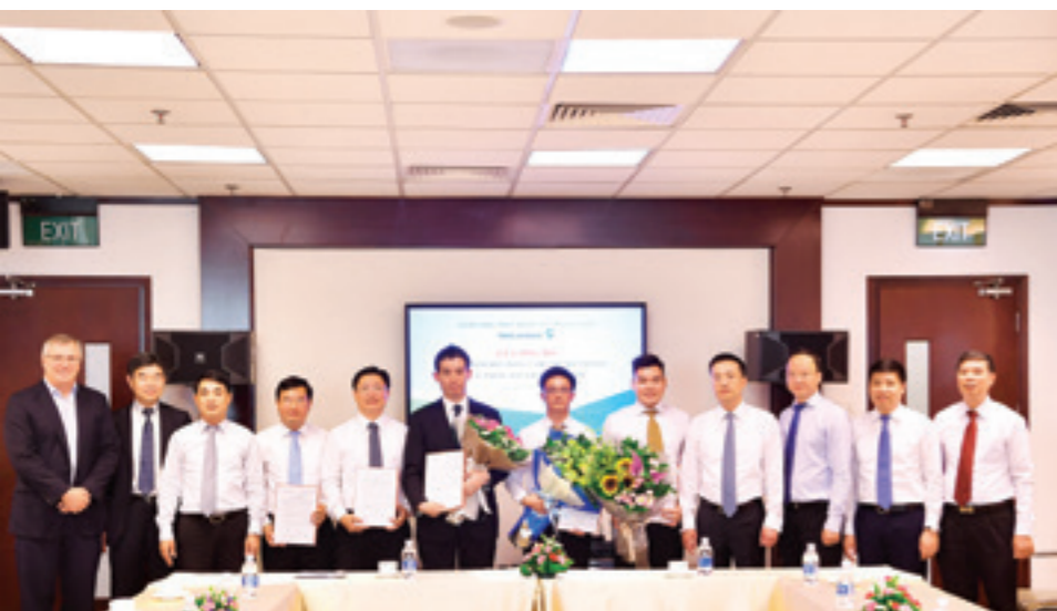
Ban Lãnh đạo Vietcombank chụp hình lưu niệm cùng các cán bộ được điều động và bổ nhiệm