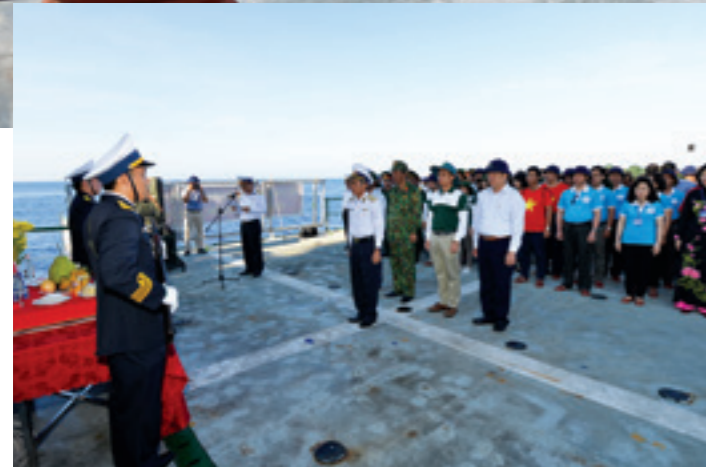
Lễ tưởng niệm các anh hùng liệt sỹ đã anh dũng hy sinh trên thềm lục địa phía Nam của Tổ quốc