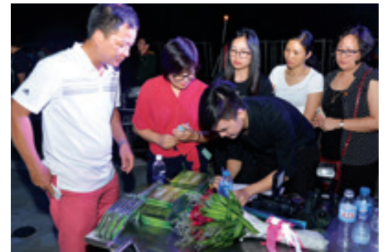
Thành viên đoàn Vietcombank mua đĩa ủng hộ Chương trình "Máy thở Trường Sa" trên tàu KN-290