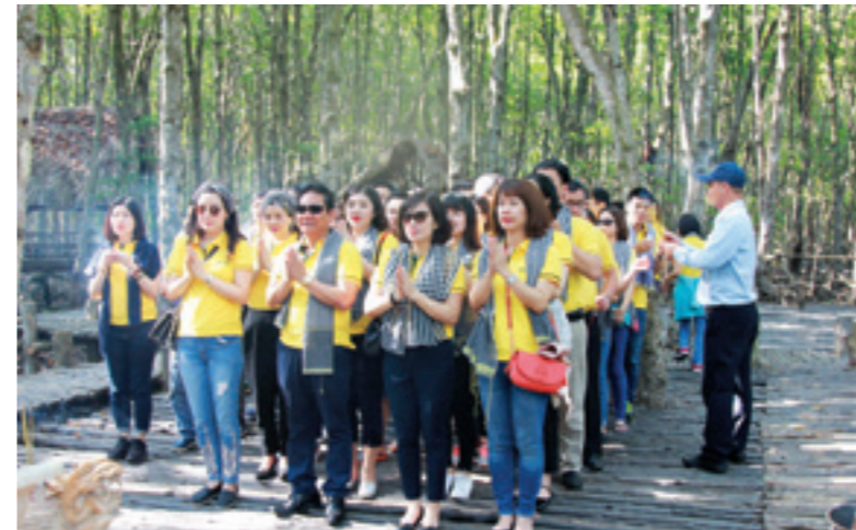
Đoàn dâng hương tại chiến khu Rừng Sác