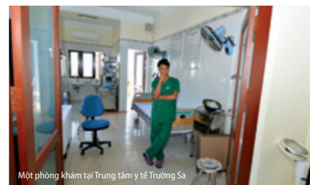
Một phòng khám tại Trung tâm y tế Trường Sa