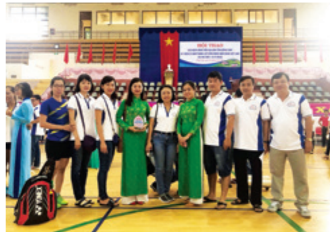
Đoàn vận động viên Vietcombank Đồng Tháp chụp ảnh lưu niệm tại Hội thao