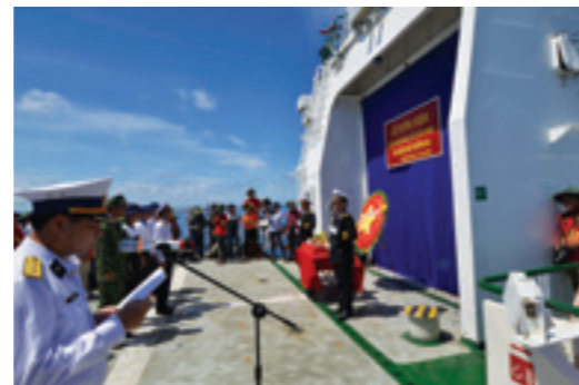
Lễ tưởng niệm các anh hùng liệt sỹ hy sinh trên quần đảo Trường Sa