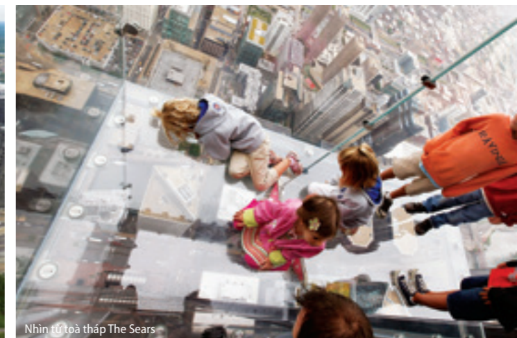
Nhìn từ toà tháp The Sears