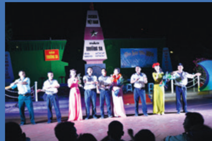
Một tiết mục giao lưu văn nghệ trên đảo Trường Sa

giàn; đều có trăn trở, suy tư và nhận thấy trách nhiệm của mình về nâng cao ý thức trách nhiệm trong bảo vệ chủ quyền biển, đảo của Tổ quốc.