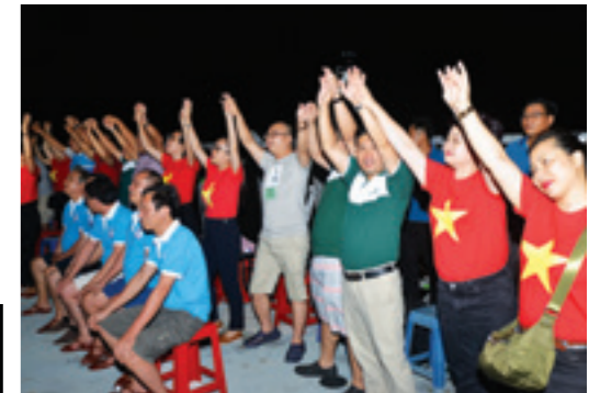
Dù đứng hay ngồi thì sự cố vũ nhiệt tình của thành viên Vietcombank luôn mang đến một không khí sôi nổi cho buổi giao lưu văn nghệ trên tàu KN-290