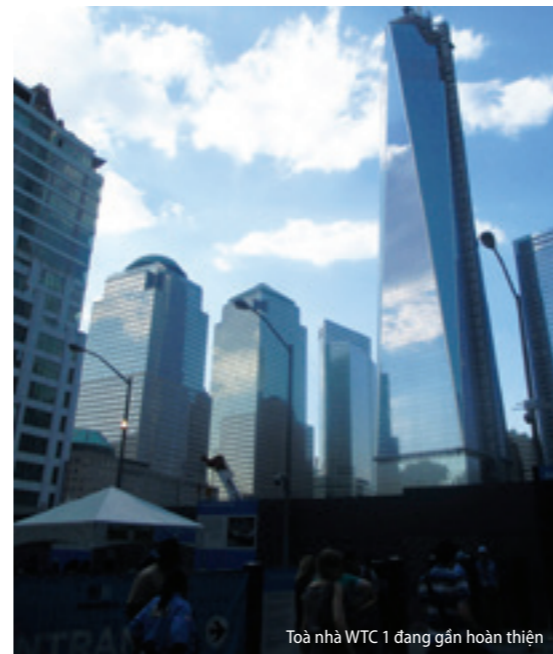
Toà nhà WTC 1 đang gần hoàn thiện