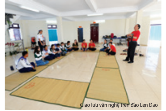
Giao lưu văn nghệ trên đảo Len Đao

Đến thăm các đảo, nhà giàn, các hạt nhân văn nghệ của Vietcombank và Đoàn nghệ thuật múa rối Hải Phòng đã phối hợp chặt chẽ với đội ngũ cán bộ là hạt nhân văn hóa văn nghệ của các Đoàn đại biểu: Viện Quân y 175/BQP, Trung ương Hội nạn nhân chất độc da cam/Đioxin Việt Nam; cán bộ, chiến sỹ trên các đảo, nhà giàn, Tàu KN - 290/Vùng 2... tổ chức nhiều chương trình biểu diễn với nhiều tiết mục gần gũi, ca ngợi về biển, đảo, về quê hương, đất nước, về người chiến sỹ Hải quân nơi đảo xa, phục vụ tận tình để động viên kịp thời cán bộ, chiến sỹ các lực lượng và nhân dân trên các đảo, nhà giàn.