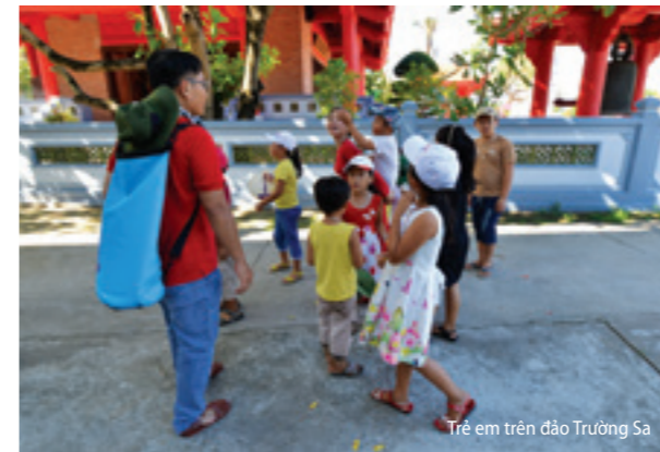
Trẻ em trên đảo Trường Sa