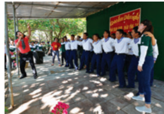
Giao lưu văn nghệ trên đảo Phan Vinh A