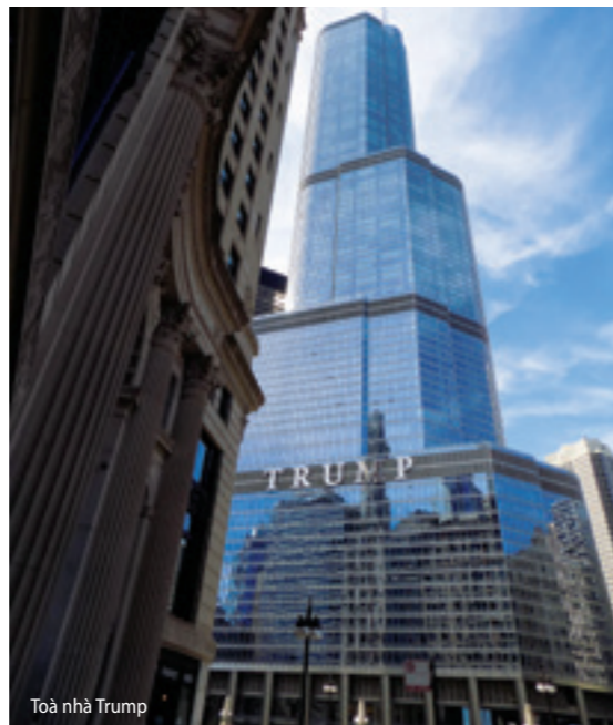
Toà nhà Trump