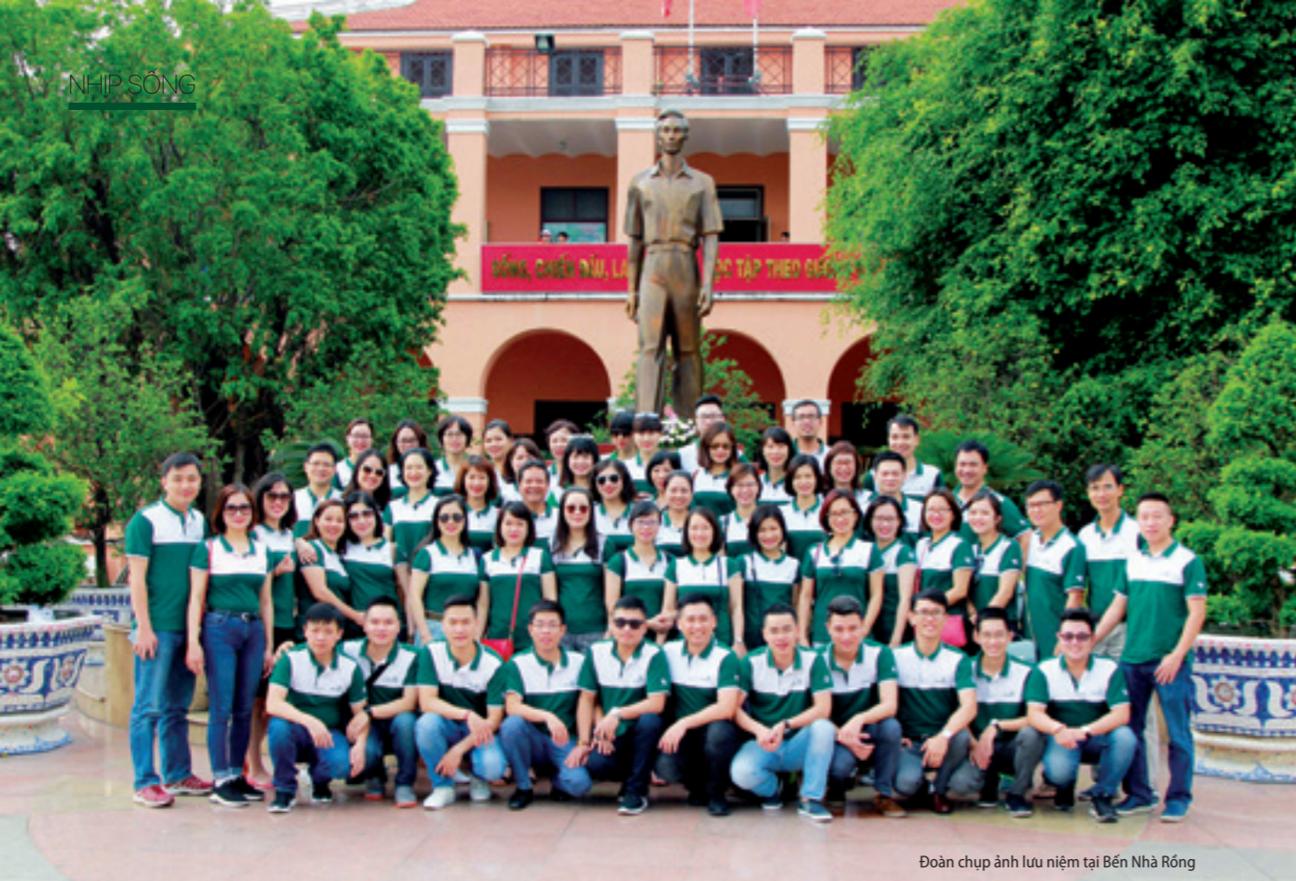
Đoàn chụp ảnh lưu niệm tại Bến Nhà Rồng