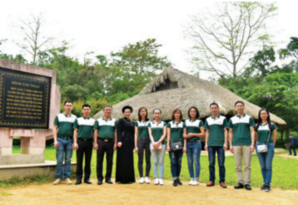
Đoàn công tác tham quan di tích Đình Tân Trào