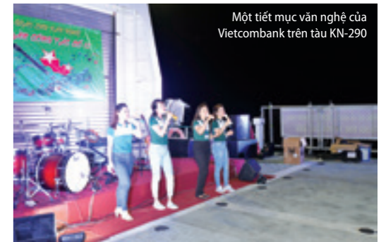
Một tiết mục văn nghệ của Vietcombank trên tàu KN-290

Đến thăm cán bộ, chiến sỹ các lực lượng và nhân dân trên các đảo, nhà giàn, tàu trực, Đoàn công tác đã dự buổi chào cờ của cán bộ, chiến sỹ trên đảo Trường Sa; gặp mặt cán bộ, chiến sỹ và nhân dân trên các đảo, điểm đảo và nhà giàn; trực tiếp nghe lãnh đạo, chỉ huy các đảo, nhà giàn báo cáo kết quả thực hiện nhiệm vụ, bày tỏ tâm tư, tình cảm, nguyện vọng và sự biết ơn trước sự quan tâm sâu sắc của Đảng, Nhà nước, các cơ quan ban, ngành Trung ương, địa phương, các tổ chức chính trị - xã hội... tới cán bộ, chiến sỹ và nhân dân huyện đảo Trường Sa, Nhà giàn DK1.