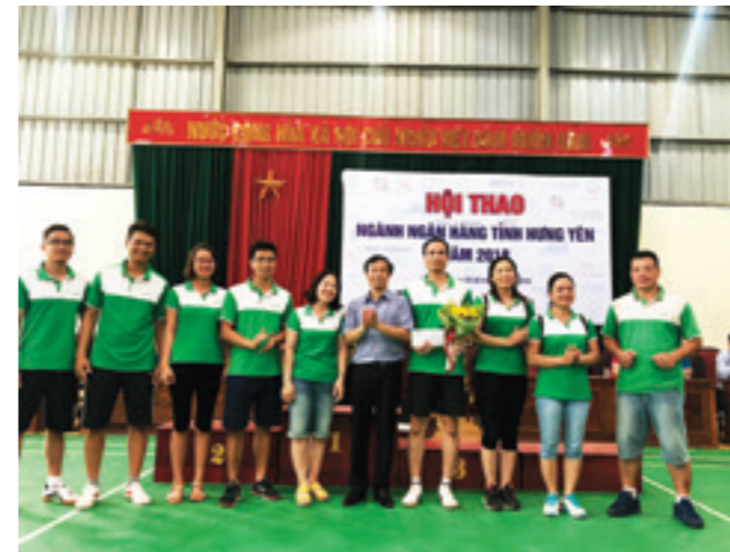
Đoàn VĐV Vietcombank Hưng Yên nhận giải Nhì bộ môn kéo co tại Hội thao NHNN tỉnh Hưng Yên

Một facebooker trên fanpage “Tôi yêu Vietcombank Đà Nẵng” đã ví các cầu thủ của chi nhánh như “những chú sư tử già” tuy móng vuốt đã cùn đi ít nhiều và sức lực đã hao mòn theo năm tháng nhưng vẫn biết cách săn mồi hiệu quả và chứng tỏ bản lĩnh đầu đàn.