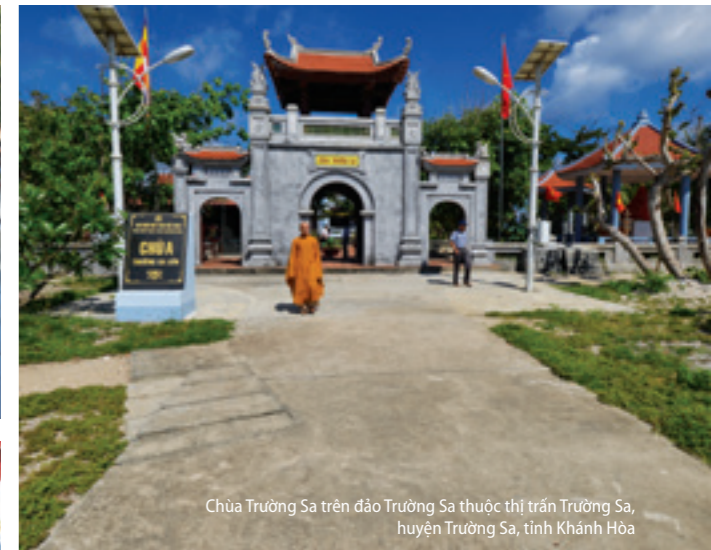
Chùa Trường Sa trên đảo Trường Sa thuộc thị trấn Trường Sa, huyện Trường Sa, tỉnh Khánh Hòa

Đối với các thành viên trong Đoàn công tác, hầu hết lần đầu tiên ra thăm đảo xa, đã nêu cao tinh thần trách nhiệm, không quản ngại khó khăn vất vả; tích cực tham gia các hoạt động trên biển, trên các đảo và nhà giàn