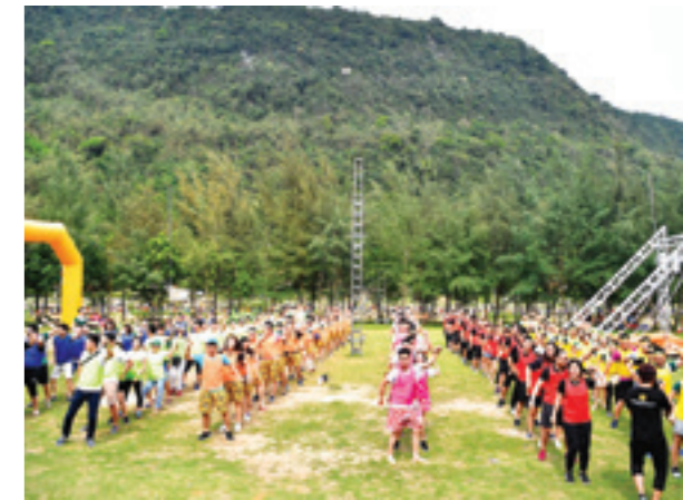
Tham gia các hoạt động teambuilding để gắn kết các thành viên trong chương trình tập huấn