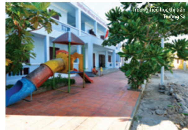
Trường Tiểu học thị trấn Trường Sa