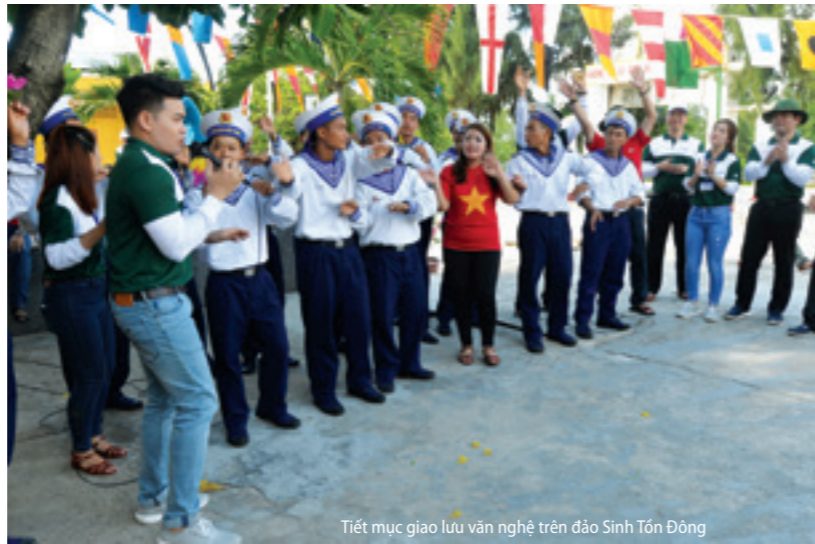
Tiết mục giao lưu văn nghệ trên đảo Sinh Tồn Đông

Đoàn công tác đã tổ chức nhiều hoạt động, với tinh thần trách nhiệm cao nhất; gần gũi, tiếp xúc, thăm hỏi, động viên và tặng quà cho quân và dân trên quần đảo Trường Sa, Nhà giàn DK1, với tổng số 538 thùng quà (trong đó có 122 thùng của Vietcombank); 1.000 cây phi lao; 300 cây dừa; 400 cây hoa giấy; 200 cây ổi; 400 bao đất cùng một số vật dụng khác phục vụ nhu cầu sinh hoạt, học tập, công tác của bộ đội và nhân dân trên các đảo, điểm đảo và Nhà giàn DK1. Đặc biệt, nhân dịp này, Vietcombank đã trao tặng 03 xuồng CQ trị giá 10 tỷ 500 triệu cho cán bộ, chiến sỹ hải quân tại Lễ tiếp nhận được tổ chức tại thị trấn Trường Sa trên đảo Trường Sa. Ngoài ra, Bảo hiểm xã hội Việt Nam cũng trao tặng 01 tỷ đồng cho Quân chủng Hải quân; Bệnh viện Quân y 175 đã tổ chức tư vấn và cung cấp đường dây nóng sẵn sàng tiếp nhận cán bộ, chiến sĩ và người thân đến khám, điều trị với mức ưu đãi cao nhất, tiến hành thăm các cơ sở quân y trên các đảo, nhà giàn; động viên và trao đổi kinh nghiệm với các thầy thuốc đang trực tiếp công tác tại đảo và nhà giàn. Thông qua đó đã kịp thời động viên quân, dân và cán bộ, chiến sỹ trên các đảo, nhà giàn yên tâm, phấn khởi trụ vững nơi đầu sóng ngọn gió, bảo vệ vững chắc chủ quyền biển, đảo thiêng liêng của Tổ quốc.