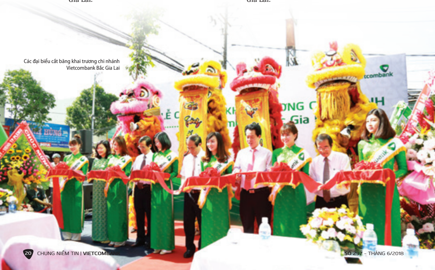
Các đại biểu cắt băng khai trương chi nhánh Vietcombank Bắc Gia Lai

Nhân dịp khai trương chi nhánh Vietcombank Bắc Gia Lai, Ban Lãnh đạo Vietcombank quyết định trao tặng thị xã An Khê - tỉnh Gia Lai số tiền 1 tỷ đồng để đầu tư cơ sở vật chất, trang thiết bị cho trường học và trạm y tế; trao tặng Bệnh viện Y học cổ truyền Gia Lai thiết bị y tế và xe cứu thương trị giá 2 tỷ đồng.