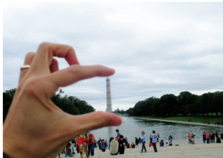
Đài tưởng niệm Washington

Lò dò đưa thân người ra ngoài ban công được bao bọc bằng những tấm kính dày, tôi cảm giác mình như được làm một con Kingkong khổng lồ khi những ngôi nhà cao vợi vợi của Chicago đều được nằm dưới đôi chân của mình.